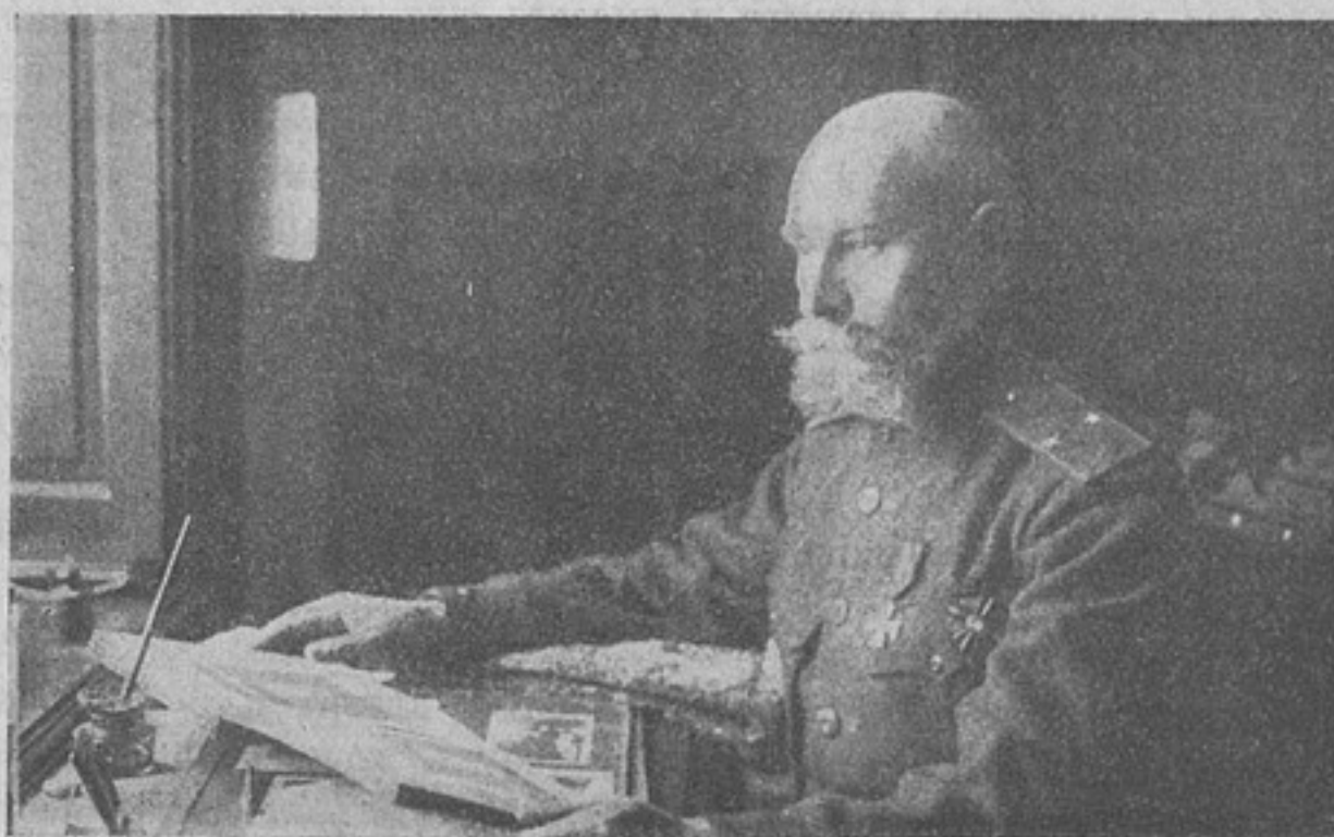
Генераль-маіоръ Нагасевъ, награжденный орденомъ Св. Георгія 4-й степени.

ныхъ силъ противника командиру баталіона, а самъ съ 66-ю развѣдчиками парировалъ всѣ попытки противника обойти нашъ правый флангъ, чѣмъ способствовалъ постепенному отходу ротъ съ боемъ на указанную позицію у д. Лушье. Отходя съ боемъ съ командою развѣдчиковъ на правый флангъ позиціи, былъ тяжело раненъ въ область живота и скончался, оказавъ незамѣнимое содѣйствіе своему полку блестящими дѣйствіями своей команды развѣдчиковъ, и Владиславу Держановскому за то, что въ бою 21-го февраля 1915 г. подъ гор. Маріамполемъ, когда превосходныя силы противника начали обходить правый флангъ полка, схватилъ изъ окопа пулеметъ и, втащивъ его на чердакъ дома, ураганнымъ огнемъ, по наступавшему противнику, прикрылъ отходъ ротъ праваго фланга на новую позицію, привлекая на себя весь огонь обходящихъ нѣмцевъ и въ теченіе нѣсколькихъ часовъ своимъ огнемъ отражалъ всѣ попытки противника къ обхвату и прорыву расположенія; въ 26-й Сибирскій стрѣлковый полкъ, Якову Терванду за то, что въ бою подъ Райгородомъ 31-го января 1915 г. занявъ командой пѣшихъ развѣдчиковъ образовавшейся прорывъ въ расположеніи полка, отразилъ атаку противника, самъ перешелъ въ контръ-атаку и заставилъ противника отступитъ, причемъ былъ смертельно раненъ.