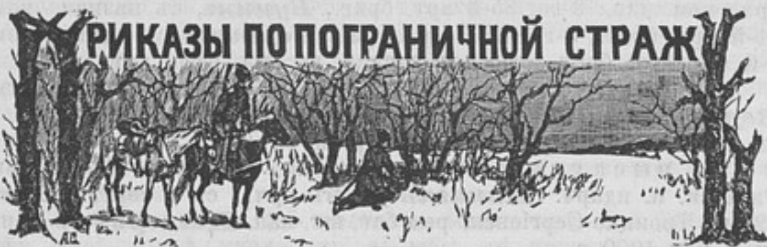
Июля 29-го дня, въ Петергофѣ .

Полож. по штату въ отдѣльн. корп. погр. стражи тремъ шт.-оф., осматр. оруж., назнач. мѣстопроб. въ нижеслѣд. пункт.: 1) въ г. С.-Петербургѣ, при упр. 1-го окр., 2) въ г. Житомирѣ, при упр. 4-го окр., 3) въ г. Тифлисѣ, при упр. 6-го окр. Раювъ же дѣйствій шт.-оф., осматр. оруж., назначить: первому — 1-й и 2-й окр.; второму — 3-й, 4-й и 5-й окр. и третьему — 6-й и 7-й окр. отдѣльн. корп. погр. стражи.